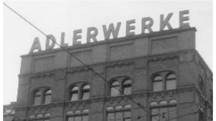
Nur noch ein Name an der Fassade: Adlerwerke

Die Überlebenden des Lagers Katzbach waren 2010 nicht zum ersten Mal in Frankfurt: Die ersten Nachforschungen nach früheren Zwangsarbeitern begannen in den neunziger Jahren aufgrund der Arbeit zahlreicher Initiativen, darunter die Arbeitsgemeinschaft ehemaliger Betriebsräte der Triumph-Adler-Werke, „Leben und Arbeiten im Gallus und Griesheim“. Aus ihr entstand später die Initiative gegen das Vergessen (IGDV). Damals wurde erstmals das Bewusstsein in der breiten Öffentlichkeit geweckt, dass mitten in Frankfurt ein KZ-Außenlager existiert hatte, das Überlebende mit den Worten charakterisierten, „Katzbach war so furchtbar, dass man sich nach Dachau zurücksehnte.“ Im Jahre 1993 lud die Stadt Frankfurt aus Anlass der Enthüllung einer Gedenktafel auf dem Gelände der früheren Adlerwerke erstmals frühere Zwangsarbeiter zu einem Besuch nach Frankfurt ein. 1997 nahmen acht Überlebende an der Enthüllung eines Gedenksteins auf dem Hauptfriedhof für 528 polnische KZ-Häftlinge teil, die in den Adlerwerken ermordet wurden oder umkamen.