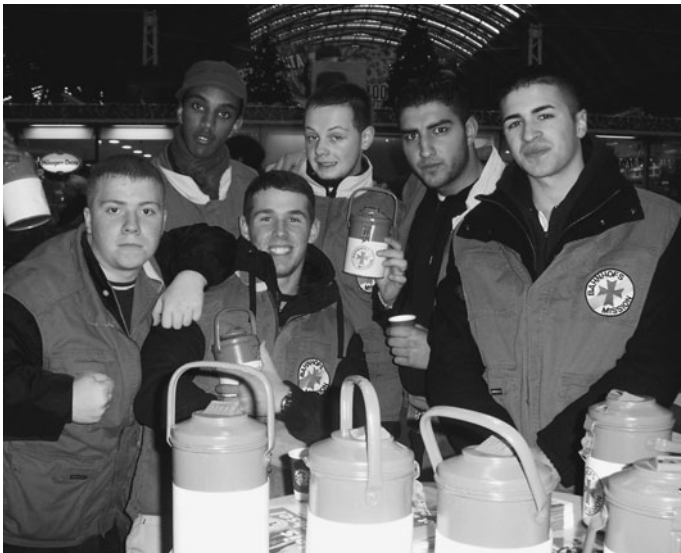
Für die Bahnmissions sammeln: Ein Beispiel für das Engagement von Jugendlichen aus Einwandererfamilien

Nach dem Bonmot eines Politikers sind Mitglieder von Einwandererfamilien dann endgültig in der deutschen Gesellschaft angekommen, wenn sie in die örtliche Freiwillige Feuerwehr eintreten und dort für die Übernahme eines Vorstandspostens kandidieren. Tatsächlich zeigt die in diesem Sommer von der Bundesregierung vorgelegte Studie mit dem etwas trockenen Titel „Erster Integrationsindikatorenbericht“ durchaus positive Ergebnisse der Integrationsbemühungen öffentlicher und privater Institutionen: Danach gibt es zwar noch eine, jedoch keineswegs signifikante unterschiedliche Engagementquote